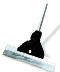
10 Osmo stålspartel