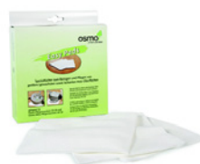
3 Osmo Easy Pad