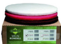
6 Osmo Rondeller