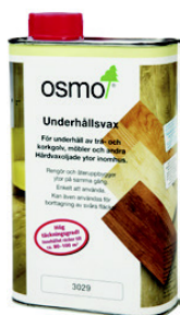
2 Osmo 3029/3087 Plejevoks