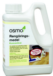
1 Osmo 8016 Rengøringsmiddel