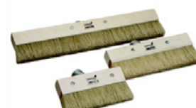
8 Rød/hvid Doodlebug