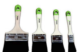
7 Osmo Pensel