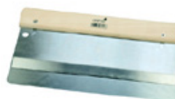
11 Osmo Dubbelspackel