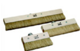
9 Osmo Penselborste