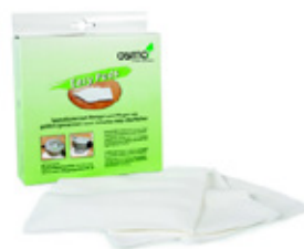
3 Osmo Easy Pad