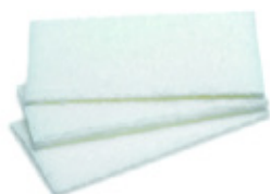
5 Vit skurnylon