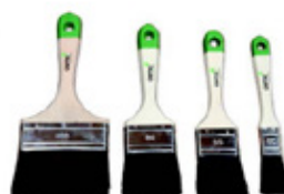
7 Osmo Pensel