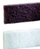
8 Röd/vit Doodlebug