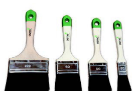
7 Osmo Pensel