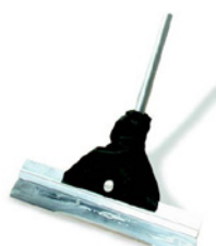
10 Osmo stålspackel