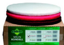
6 Osmo Rondeller