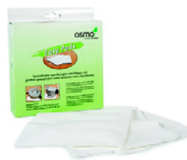
3 Osmo Easy Pad