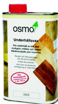
2 Osmo 3029/3087 Underhållsvax