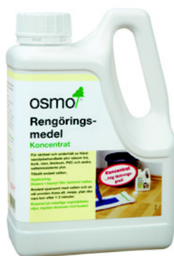
1 Osmo 8016 Rengöringsmedel