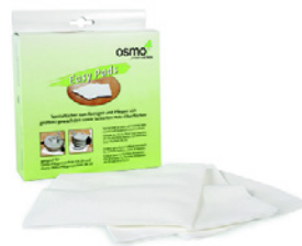
3 Osmo Easy Pad