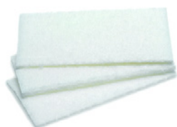
5 Hvis nylyonsvamp