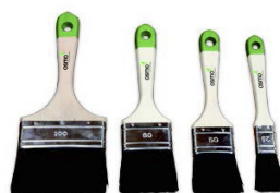
7 Osmo Pensel