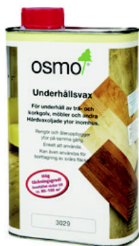
2 Osmo 3029/3087 Plejevoks