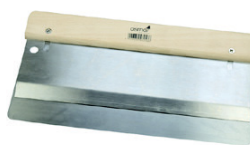
11 Osmo Dobbeltspatel