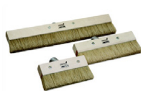
9 Osmo Penselbørste