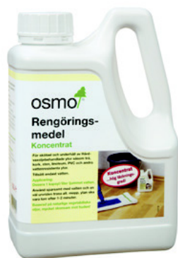
1 Osmo 8016 Rengøringsmiddel