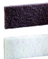
8 Rød/hvid Doodlebug